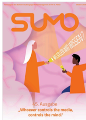
SUMO #45 sumomag