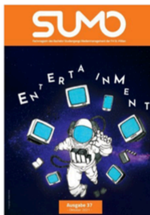
SUMO #37 sumomag