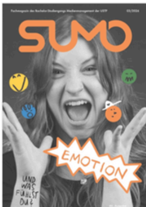
SUMO #46 sumomag