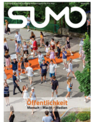
SUMO #43 sumomag