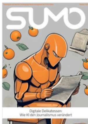
SUMO #41 sumomag