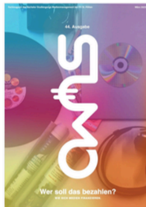
SUMO #44 sumomag