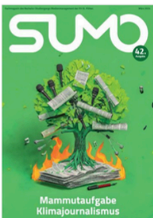
SUMO #42 sumomag